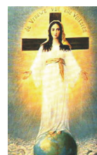
Akita, Japón 1973