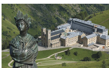
La Salette, Francia 1846

Todo ello como parte de una preparación del pueblo de Dios, para que, pasando por una purificación durante la tribulación, finalmente aquellos que hayan perseverado y hayan sido sellados con el Sello Divino, puedan ver el triunfo del Inmaculado Corazón de María y el reinado del Sagrado Corazón de Jesús.