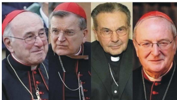
Los cuatro cardenales que enviaron la Dubia

Por supuesto, que referente a lo anterior podemos afirmar categóricamente que tampoco ha realizado el papel que le correspondería a un pontífice en lo referente a confirmar en la fe y aclarar dudas al pueblo de Dios. Inmediatamente después de haber sido publicada la exhortación apostólica "Amoris Laetitia", numerosos líderes católicos de todo el mundo, entre ellos sacerdotes, obispos y cardenales solicitaron a Bergoglio aclarara lo expuesto en el capítulo VIII, preguntando que si con esto pretendía cambiar las enseñanzas de 2000 años de la Iglesia; incluso fue formulada una carta y enviada por los medios oficiales correspondientes al Vaticano firmada por 4 cardenales: Cardenal Carlo Caffarra, Cardenal Raymond L. Burke, Cardenal Joachim Meisner y el Cardenal Walter Bradmüller (carta hoy conocida como la dubia, la cual, al no obtener respuesta fue publicada para que fuera del conocimiento de todos los católicos), en la que, como es su derecho, formularon preguntas en donde solamente podría el papa contestar sí o no; a todo lo anterior Bergoglio solamente contestó en una conferencia con insultos a quienes se oponían a los cambios llamándoles en pocas palabras retrógradas.