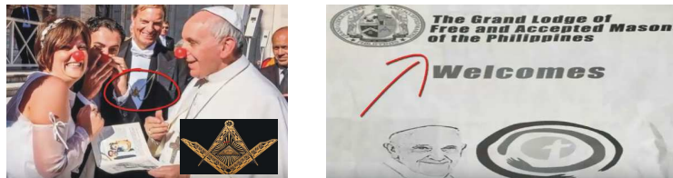
Bergoglio es constantemente acompañado de personajes que ostentan sin ningún empacho los símbolos masónicos

*** ¿Porqué a Bergoglio no se le aplicarían las condenas pontificias de excomuni3n y las penas establecidas por SS Juan Pablo II para quienes transgredieran los lineamientos para elegir un nuevo pontífice? ***