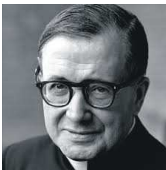
San Josemaría Escrivá de Balaguer Fundador del Opus Dei

a los mismos” (por lo que no se tendría la capacidad ni las herramientas para advertir a otros de tal situación o problema).