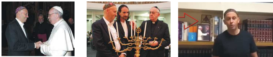
Bergoglio participando en un evento con sionistas masones antes de ser nombrado cardenal

Además está el hecho de que Jorge Mario Bergoglio desde muy joven fue introducido a la masonería, por lo que ya desde entonces se encontraba excomulgado, al igual que quienes urdieron el complot en contra de Benedicto XVI y para elegir a Bergoglio.