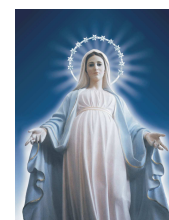
Medjugorje, Bosnia 1981 a la fecha

El pensamiento generalizado moderno de hoy ya se ha permeado en gran medida al pensamiento del católico (incluyendo a sacerdotes y obispos), consistiendo en un afán por no agobiarse, no sufrir, no mortificarse, dejar que cada quien haga lo que quiera, que cada quien piense como quiera, y en realidad, es para la gran mayoría un desconocimiento total el hecho de que tal pensamiento haya sido planeado, moldeado, provocado por la masonería en los últimos 300 años (inexistencia del demonio, inexistencia del infierno, un mundo que durará para siempre, relativismo, modernismo, ideología de género, aprobación del aborto, homosexualismo, generalización del pecado, panteísmo, sincretismo).